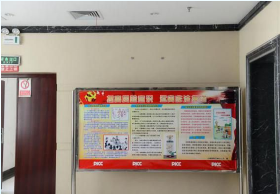
□人保财险巴州分公司

截止 5 月 25 日，全辖已悬挂横幅 9 条，张贴标语 24 条，制作展板 10 块。通过晨会宣导 16 次，参加活动人员累计达 260 余人次。目前，全辖防范打击非法集资宣传活动正在进行之中。