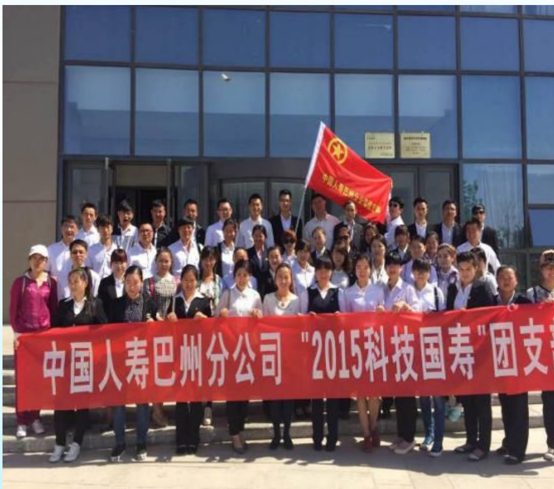
□中国人寿巴州分公司

今后，中国人寿巴州分公司团支部将继续开展不同主题的共青团活动，望广大共青团员积极参与，认识到当代巴州青年肩负的历史责任与重大使命。并不断提升自我综合素质，积极发挥党和政府联系青年的桥梁和纽带作用。